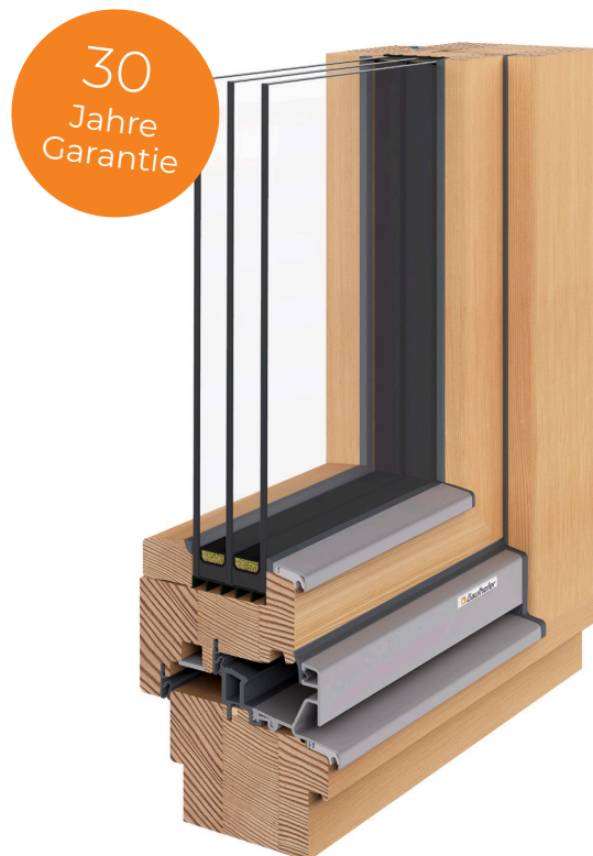
Holz NATURELINE 92